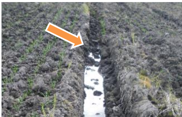
畝から崩れ落ちた土塊を溝さらえし、滞水しないよう整備する