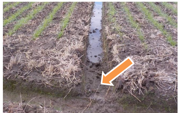
排水溝の浅いところを溝さらえし、水尻側が低くなるように勾配を付ける