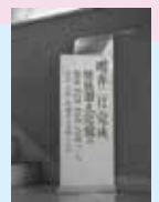
琵琶湖文化館建設募金箱