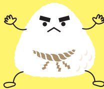
イメージキャラクター おむすび山(小結)