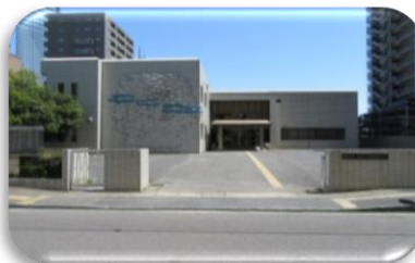
大津・高島子ども家庭相談センター