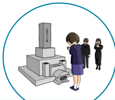
保護者の死亡・行方不明など