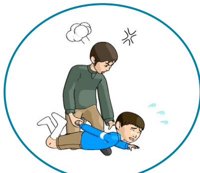
保護者からの虐待