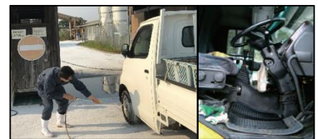
車両はタイヤだけでなく、 泥よけの内側まで消毒し、フロアマットの交換やペダル等車内も消毒