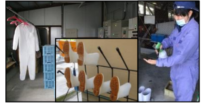
専用の服や靴の使用、手指消毒