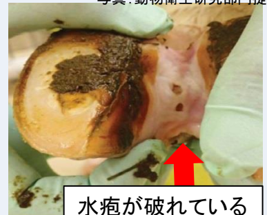
水疱が破れている

毎日必ず健康観察し、これらの症状を見つけ次第、直ちに獣医師や家畜保健衛生所に連絡 しましょう。