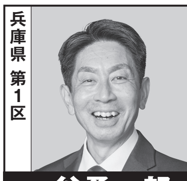
兵庫県 第1区 一谷勇一郎