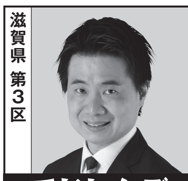
滋賀県 第3区 でしんご