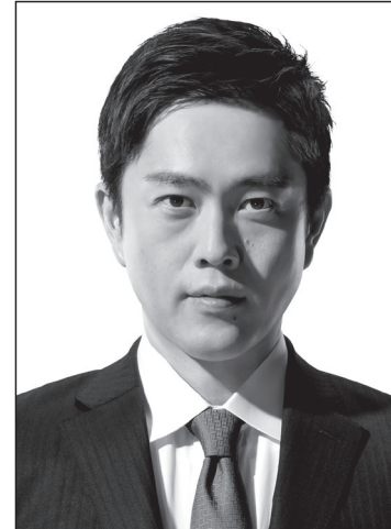
代表 吉村 洋文