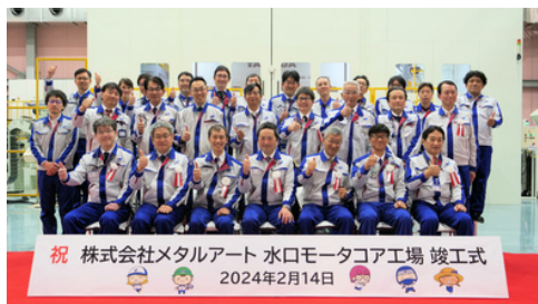
2024年：モータコア工場竣工式