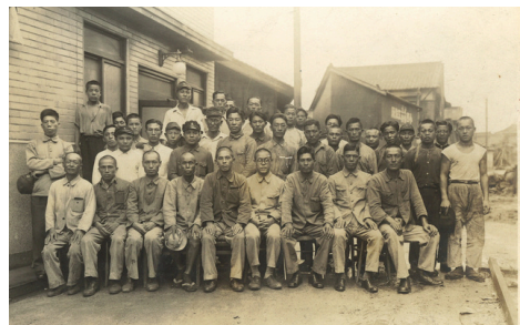
1916年頃：創業当時の写真