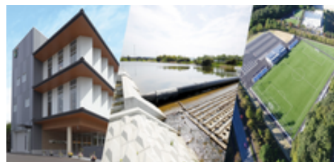
幅広い事業展開（調査/計画/設計）