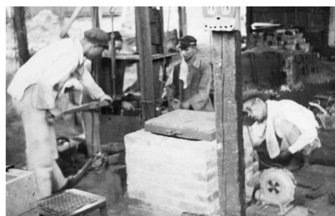
5人で創業した当時の製造風景