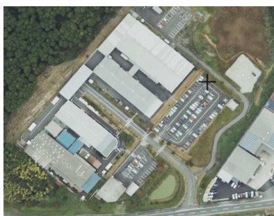
2024年：現在の工場航空写真