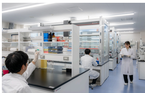
ラボで行う分析・検査事業