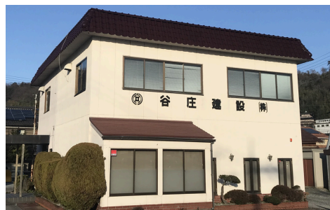
創業当初の本社外観