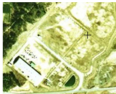
1971年頃：創業当時の工場航空写真