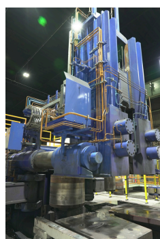
25億円を投資した最新大型ライン