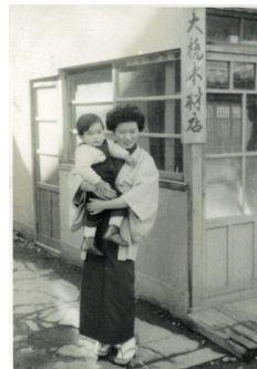
創業時の本社外観