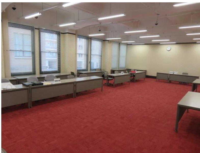
立候補届出会場の設営 (10月13日)