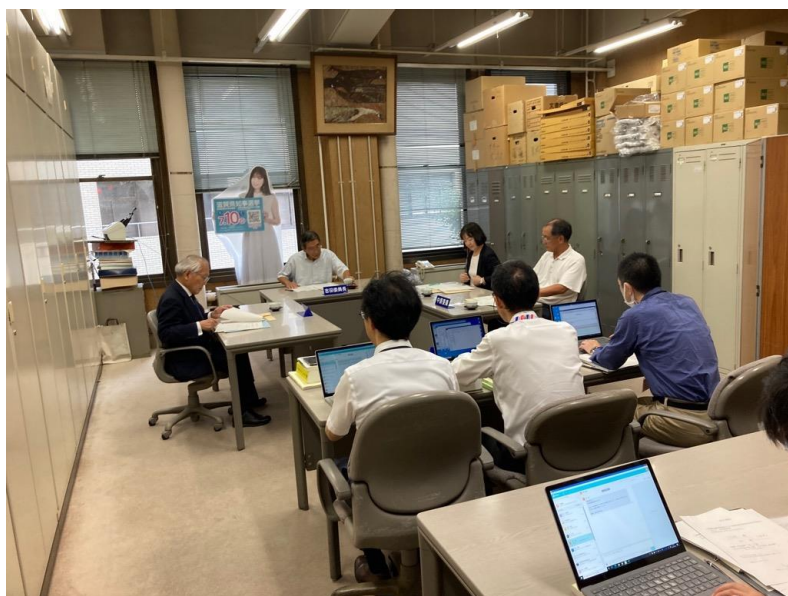
臨時選挙管理委員会 (10月4日)