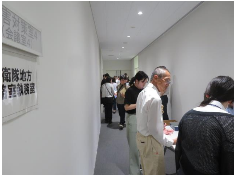
候補者届出予定政党・立候補予定者 説明会(2) (10月7日)