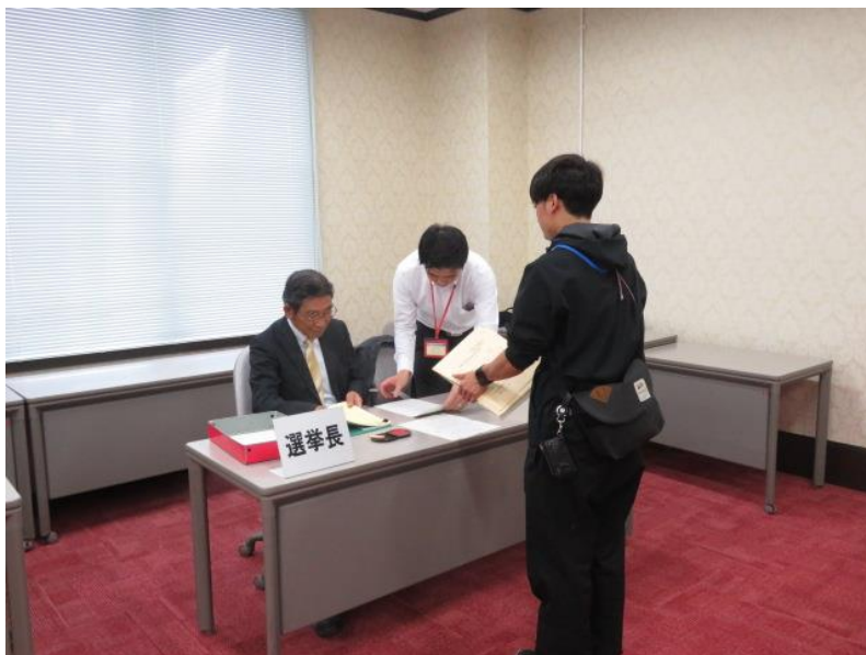
立候補届出受付(3) (10月15日)