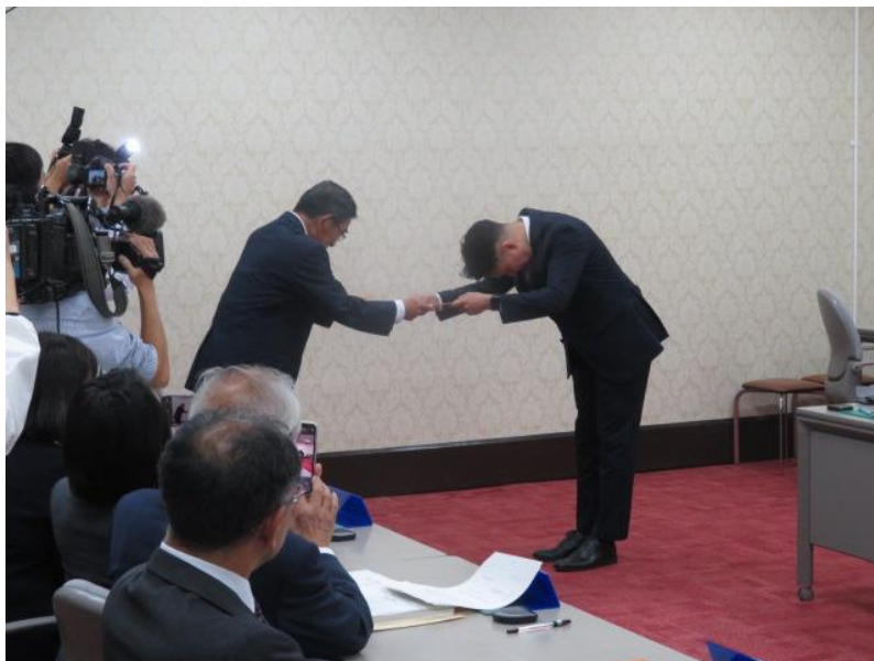
当選証書の付与(1) (10月30日)