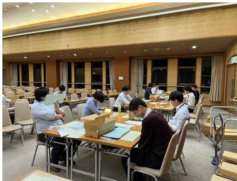
ビラ証紙の点検作業(1) (10月10日)