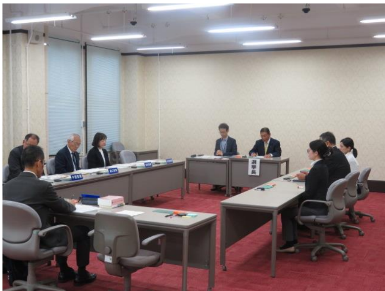
選挙会(1) (第1区) (10月30日)