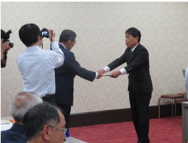
当選証書の付与(3) (10月30日)