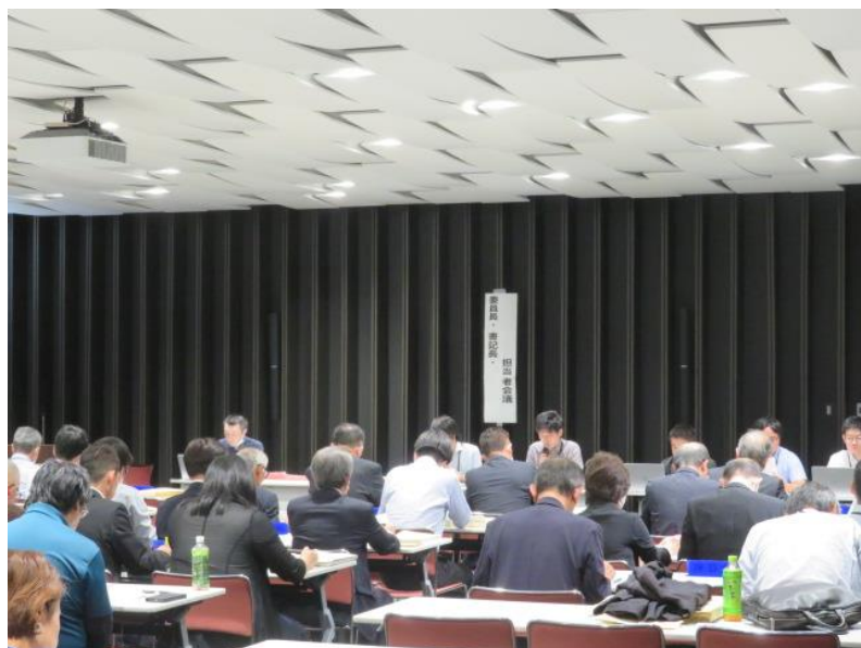
市町選管委員長・書記長・担当者会議 (10月11日)