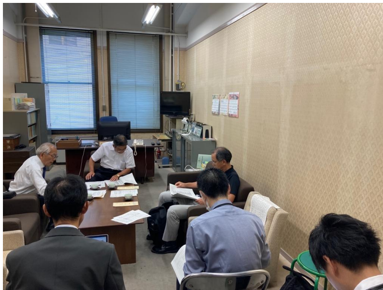
臨時選挙管理委員会 (10月10日)