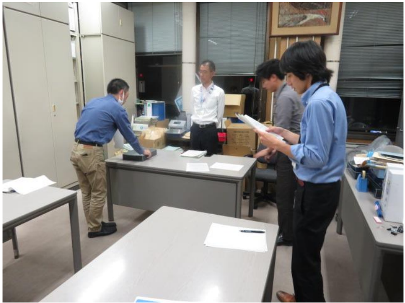
名簿届出政党等の名称等の掲示の 掲載順序を定めるくじの執行 (10月15日)