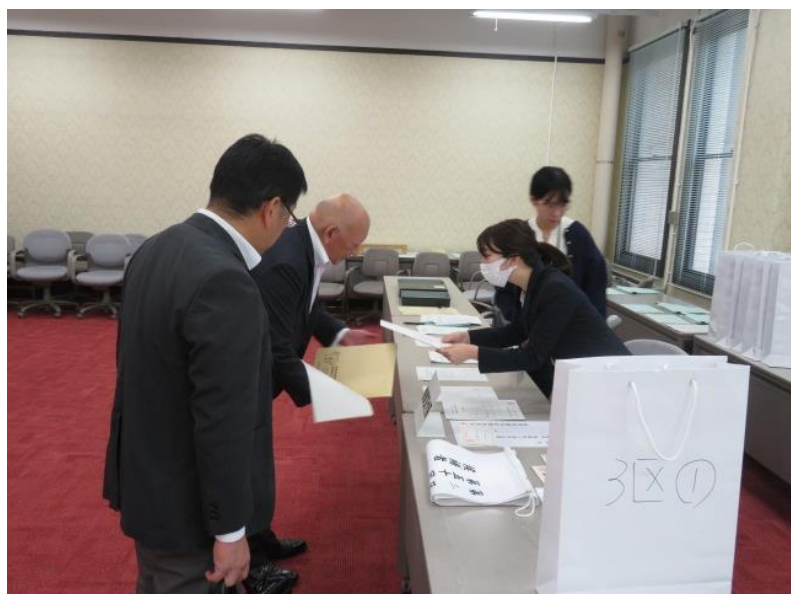
立候補届出受付(4) (10月15日)