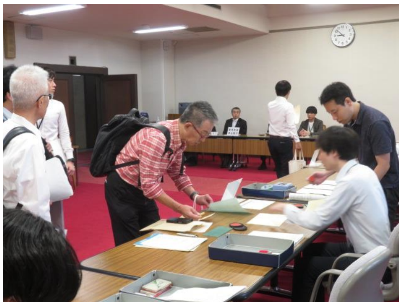
立候補届出受付(6) (10月15日)