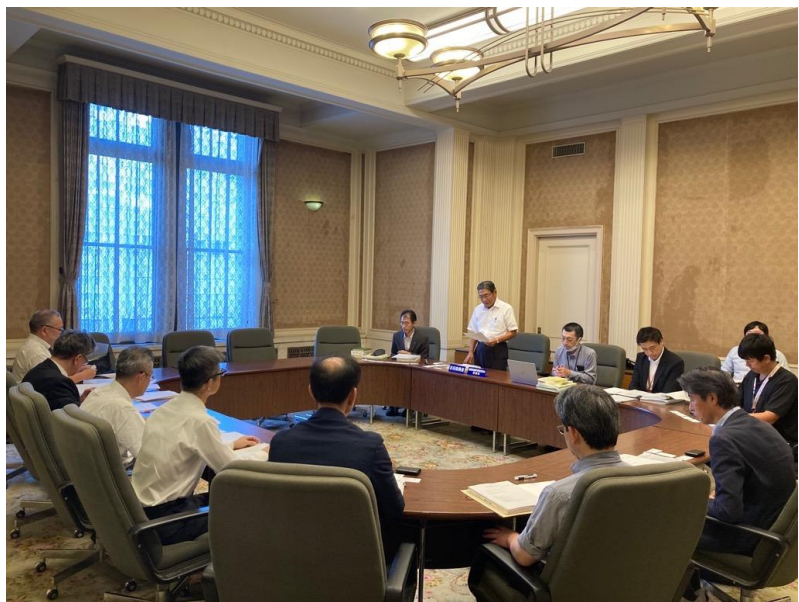
報道代表打合せ会 (10月10日)