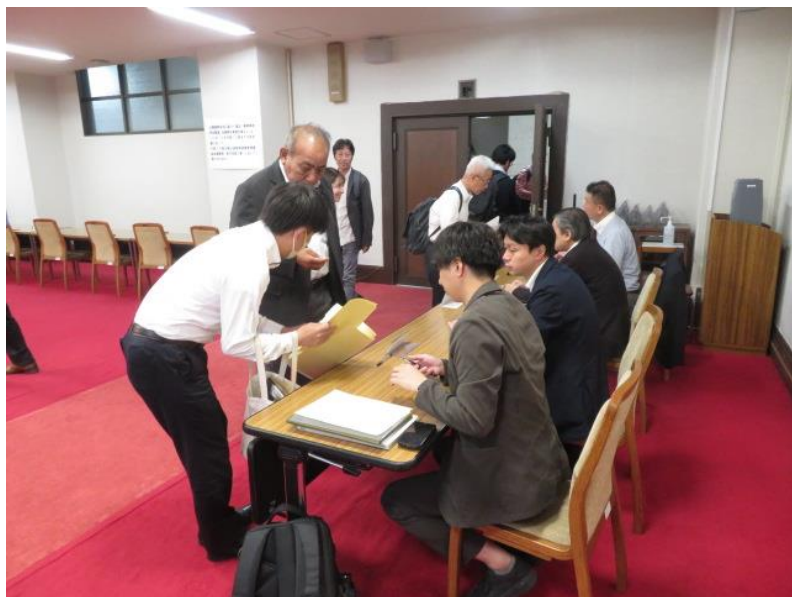
立候補届出受付(7) (10月15日)