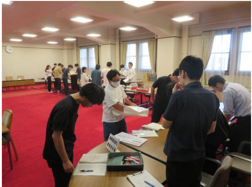
立候補届出受付事務リハーサル(1) (10月14日)