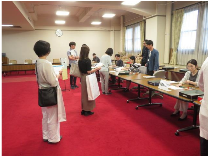
立候補届出受付事務リハーサル(4) (10月14日)