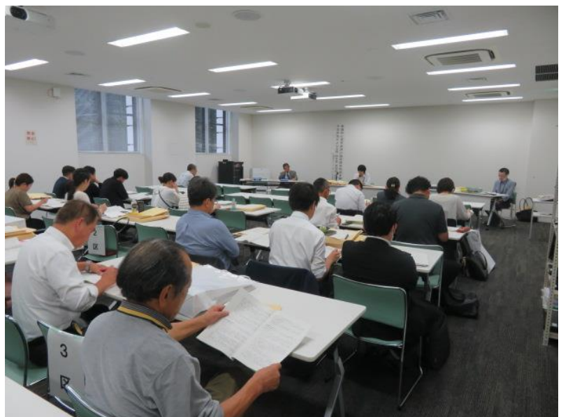
候補者届出予定政党・立候補予定者 説明会(4) (10月7日)