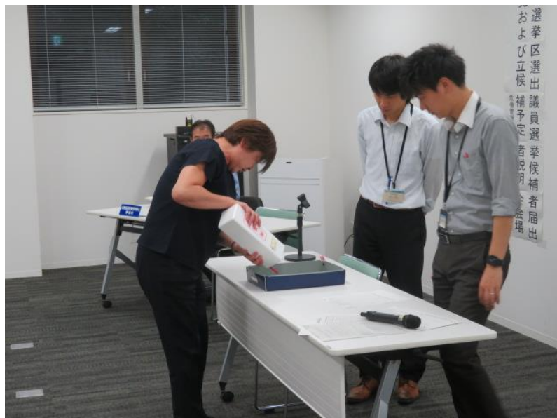
候補者届出予定政党・立候補予定者説明会(7) (10月7日)