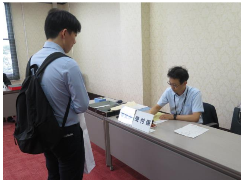
立候補届出受付(2) (10月15日)