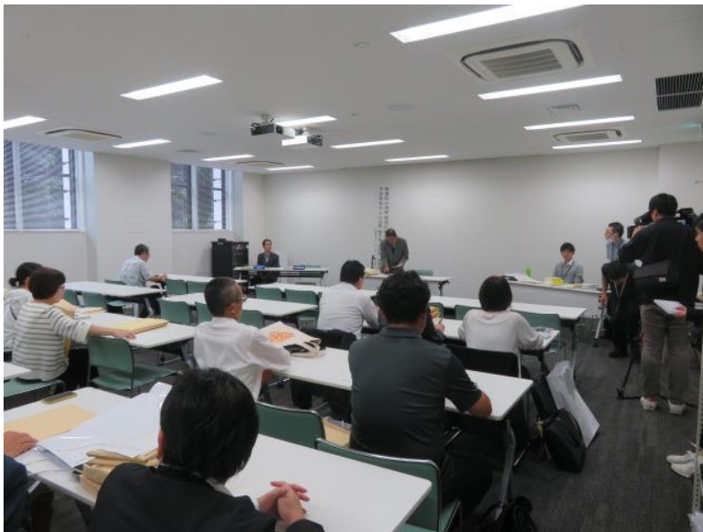
候補者届出予定政党・立候補予定者説明会(6) (10月7日)