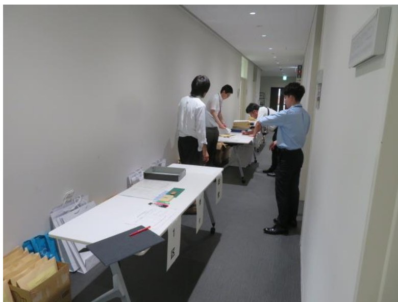
候補者届出予定政党・立候補予定者 説明会(1) (10月7日)