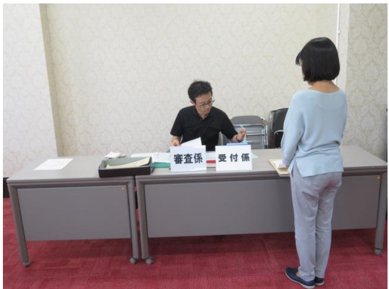
立候補届出受付事務リハーサル(3) (10月14日)