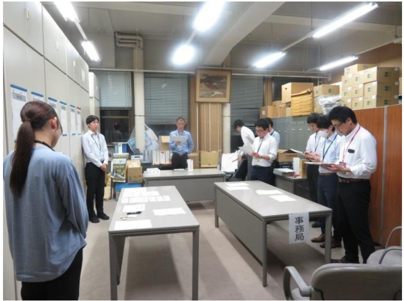
選挙公報の掲載順序を 定めるくじの執行(比例) (10月16日)