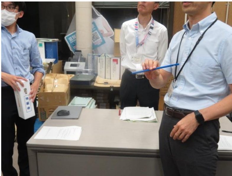
政見放送の日時を定めるくじの 執行(1)(10月15日)