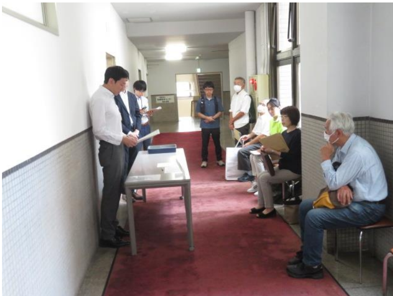
立候補届出受付(1) (10月15日)