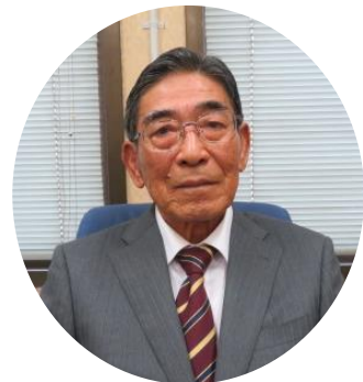
滋賀県選挙管理委員会委員長