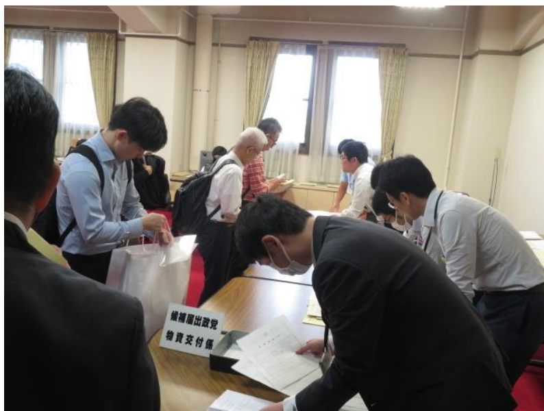
立候補届出受付(5) (10月15日)