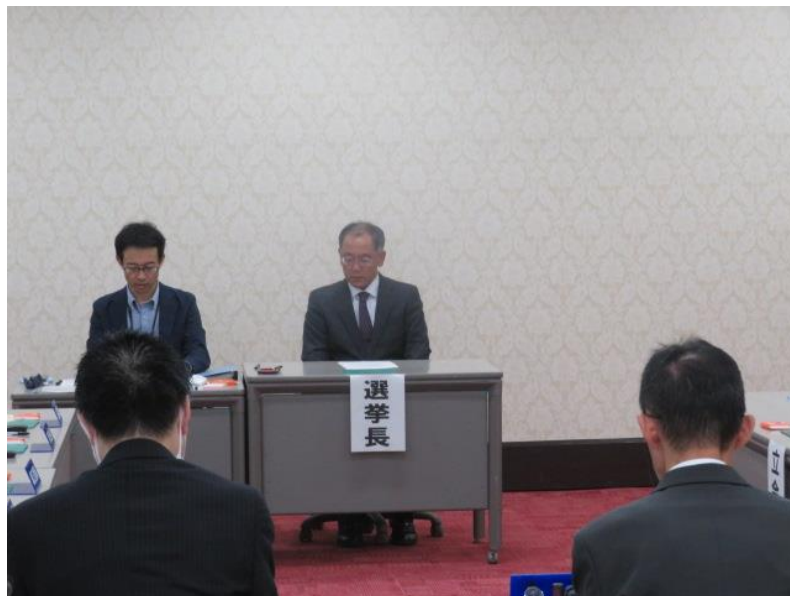
選挙会(5) (第3区) (10月30日)