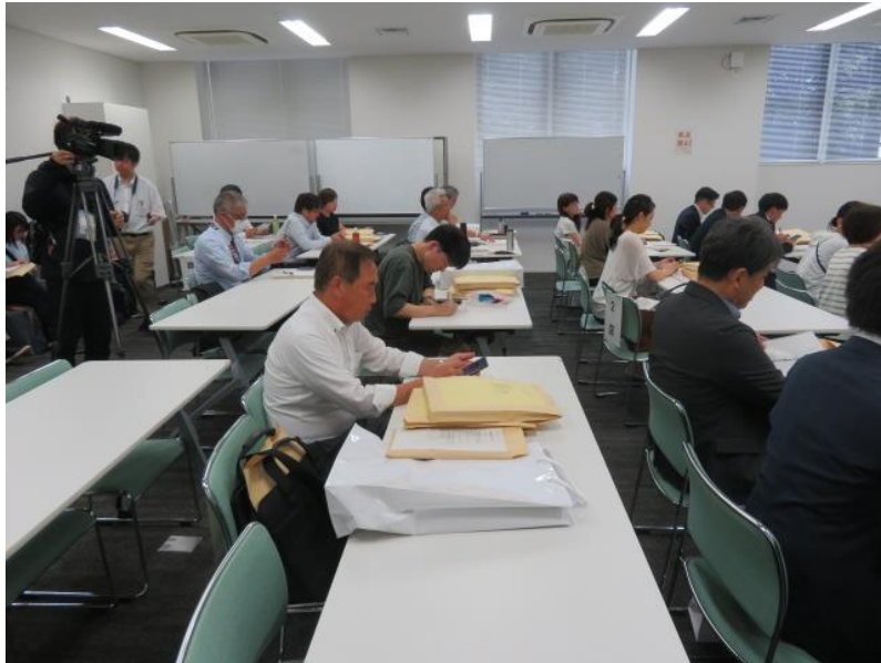
候補者届出予定政党・立候補予定者 説明会(3) (10月7日)