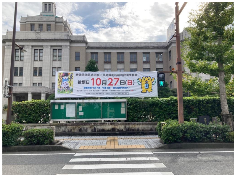
県庁本館前大看板