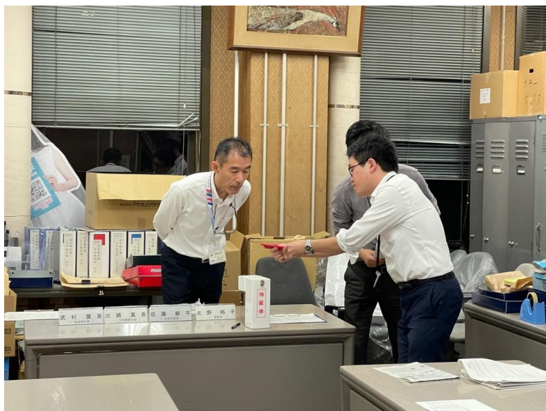
選挙公報の掲載文の掲載順序を 定めるくじの執行(小選挙区) (10月15日)