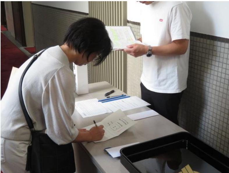
立候補届出受付事務リハーサル(2) (10月14日)