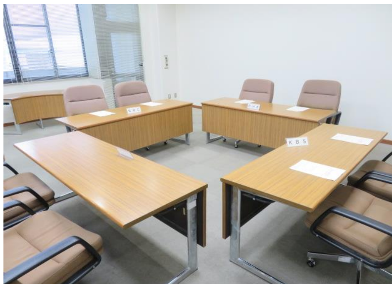
政見放送等の実施に関する打合せ会 (10月4日)