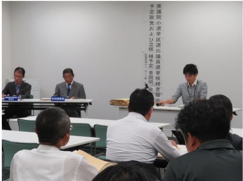
候補者届出予定政党・立候補予定者説明会(5) (10月7日)