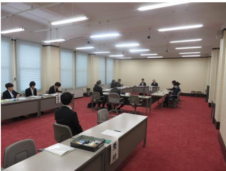
選挙会(3) (第2区) (10月30日)