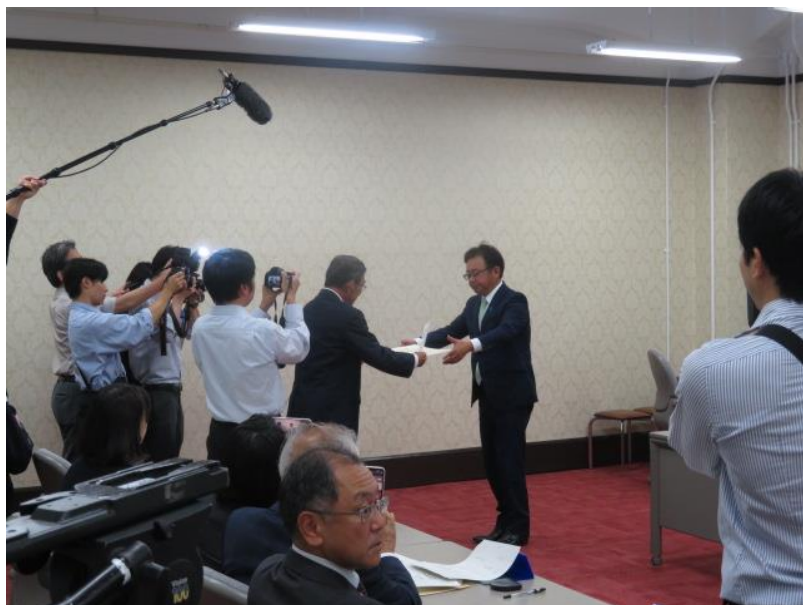
当選証書の付与(2) (10月30日)