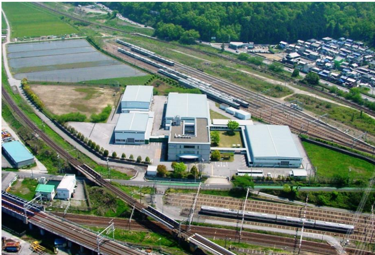
テクノカレッジ米原 校舎全景

新しく社会へ扉を開こうとする方。 新しく道を見いだすための扉を探している方。 テクノカレッジはあなたの可能性の扉を見出し、 職業生活におけるターニングポイントの機会を 生かせるようお手伝いをいたします。