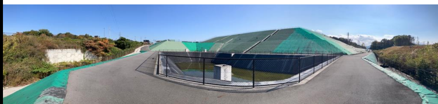
写真② 調整池付近の様子