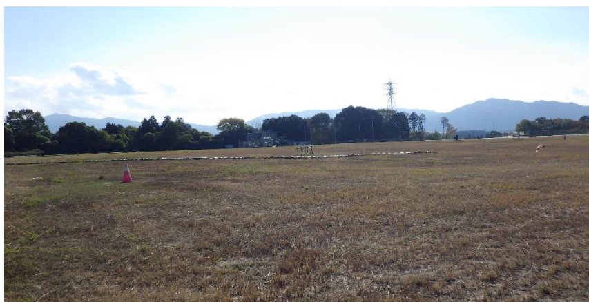
写真① 天端部の様子