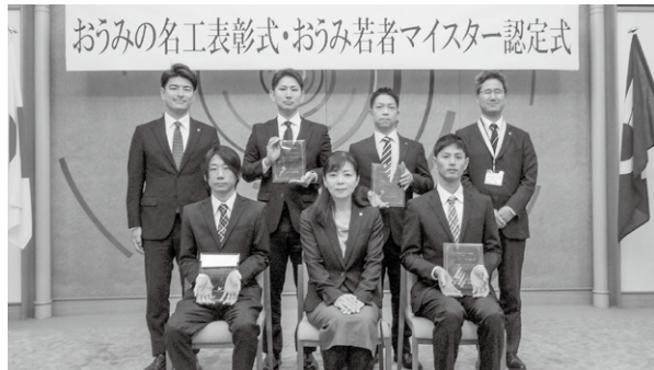
▲「おうみ若者マイスター」認定者