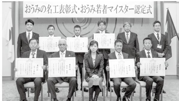
▲「おうみの名工」表彰受賞者