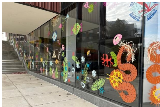
ミシガン大学自然史博物館のガラス面をしたパブリックアート。

教授の作品は、絵画だけでなく、町の公共空間やカフェ、病院などとコラボレーションしたパブリックアートも魅力の一つです。このパブリックアートは、参加型で作品を作り上げることができることから、ミシガン州から留学中の学生や、ミシガン友好親善使節団参加者などミシガンと滋賀に関わる様々なメンバーに参加してもらえば、交流をさらに深めるきっかけになり、2028年の姉妹協定60周年に向けた参加型イベントとしても貴重な機会になるかもしれません。