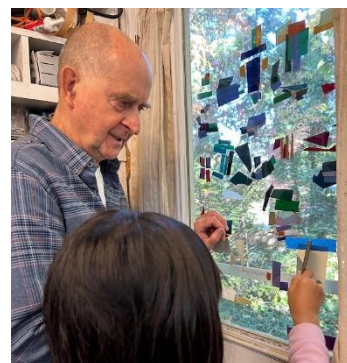
ローラーを使い、ビニールを貼る過程。

2つの姉妹都市、2つの姉妹県州、2つの国をつなぐような取り組みができればとてもうれしい。