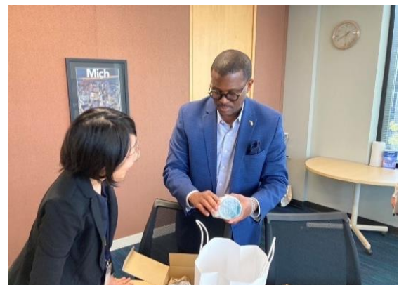
プレゼントは琵琶湖ブルーの信楽焼コーヒーカップ。

メッサーJr.総裁からは、滋賀県との関係は大変重要であると考えており、フランクに親密に交流を深めていきたい、滋賀県からミシガンを来訪予定の企業について面会先を探し支援できるのは大変うれしい、とのコメントを頂きました。