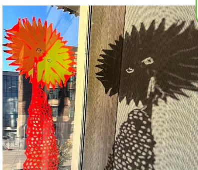
一日の中でも日のさす角度によって表情が変わるのも魅力。

2つの姉妹都市、2つの姉妹県州、2つの国をつなぐような取り組みができればとてもうれしい。