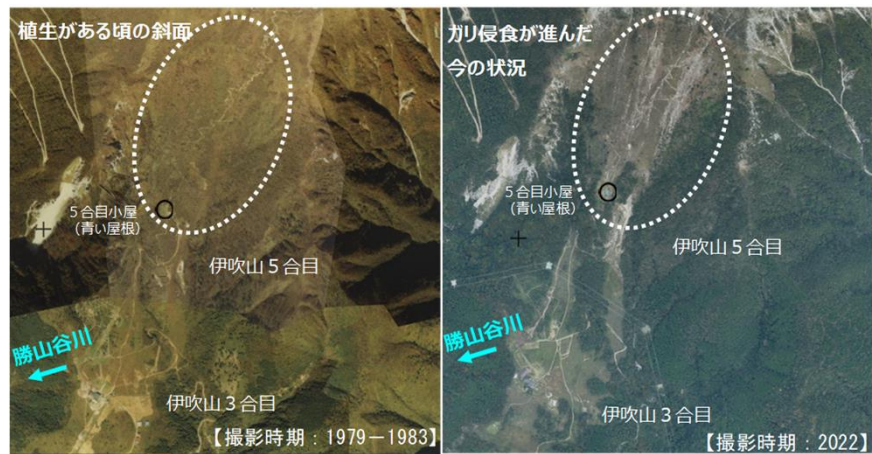
【撮影時期：1979－1983】 【撮影時期：2022】 伊吹山南側斜面の植生の変化