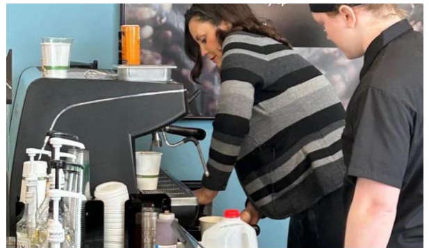
2 月、ミシガン・リコネクトの 4 周年を祝うため、グランドラピッズコミュニティカレッジを訪れ、ラボでラテを作るホイットマー知事。

2 月のホイットマー州知事の施政方針演説の中でも、「ミシガン・リコネクト」への登録は、女性と男性が 2 対 1 となっており、若い男性をより巻き込んでいくための努力が必要との言及がありました。ホイットマー州知事は事態を重く受け止めており、4 月、より多くの若い男性が高等教育や熟練職業訓練を受けるよう促すための行政命令に署名しています。