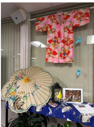
↑日本月間でセンターの中にも日本のものが多数展示。

10 名を超える参加者から活発な意見や質問をもらいました。中には、過去、栗東市から使節団を受け入れていた時のことを知る人もおり、「元市議会議員をしていたが、2010 年ごろ、毎年栗東市から 10 人ほどの団を受け入れており、活発な活動を行っていた。友好親善使節団は大変素晴らしいプログラムだった。」とのコメントや、栗東市から提供された白黒の写真を見て、「これはあの時の市長でないか、市役所でないか。」と参加者同士での会話も弾んでいました。姉妹都市そのものや、過去の学生交流に興味を持ってくださった方もいました。