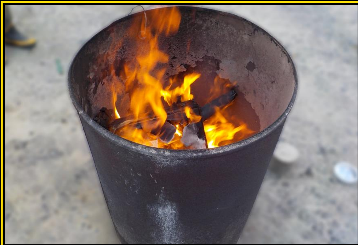
Membakar dengan drum