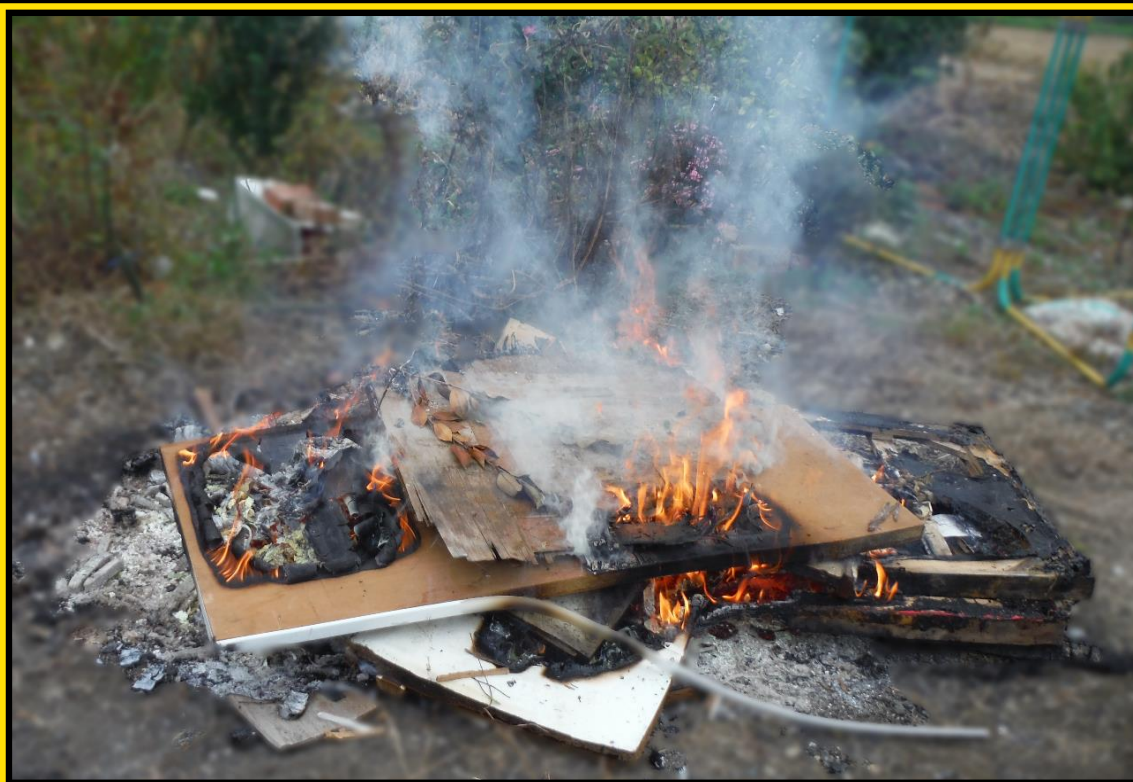
Membakar di tanah atau di dalam lubang yang digali di tanah

(*Selain hal di atas, perusahaan akan dikenakan denda hingga 300 juta yen.)