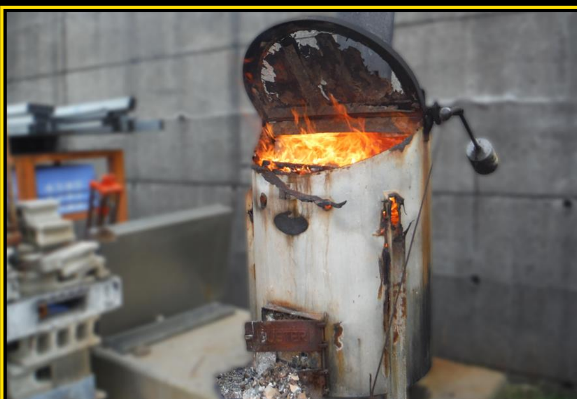
Incineração em incineradores não conformes