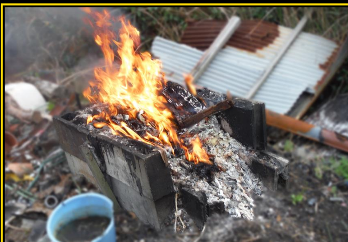
用水泥预制板墙等围起来焚烧