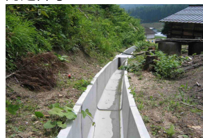
MRS II GSフリーウム