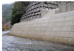
MRS II ゴ・ブロック