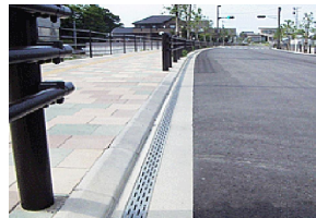
MRS II ロードレイン