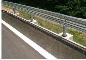
MRS プレガードⅡ BC種