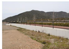
MRS II SL-K