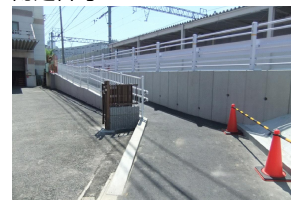
MRS II マルチSL-F