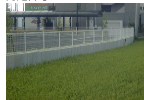
MRS II SL-F