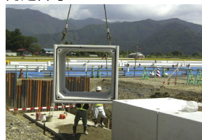
MRS II ボックスカルバートC型