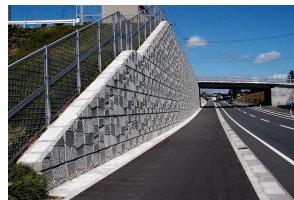
MRS II High-T Wall