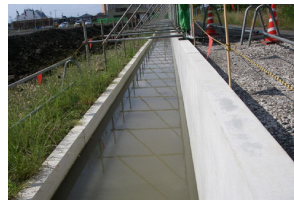
MRS II オープンカルバート