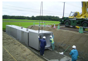
MRS II ボックスカルバートK型