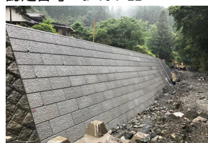
MRS II ステラウォール