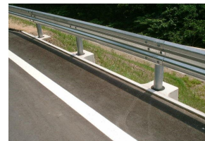
MRS II プレガードII BC種