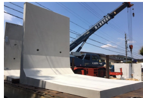
MRS II SL-R