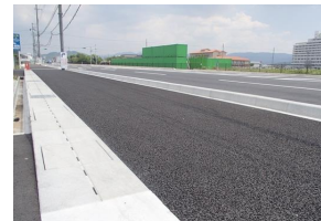
MRS II Cドレーン