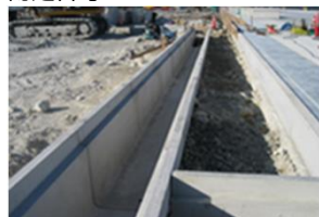
MRS II OGSフリーウム