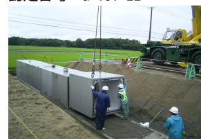
MRS ボックスカルバートK型