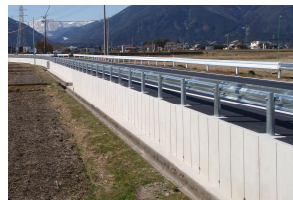
MRS II SL-G