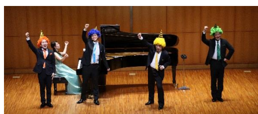
びわ湖ホール四大テノール