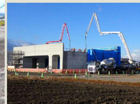
女性技術者が担当した構造物 野洲栗東バイパス出庭西地区函渠他設置工事