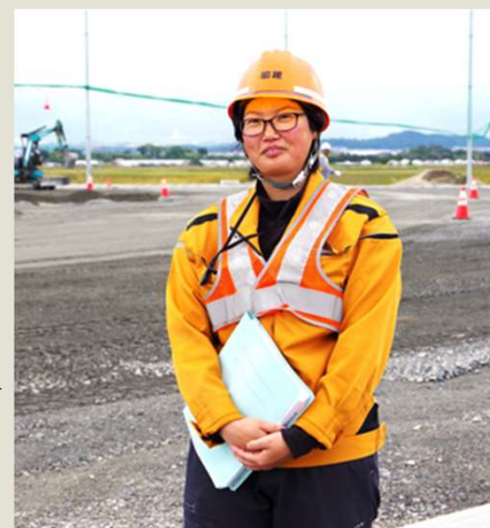
昭建で活躍中の女性技術者

工事現場の仕事は、力仕事だけではなく、機械を動かす人、現場を指揮する人、パソコンを使う人など様々です。測量機器やドローンなど最新技術を積極的に取り入れ、生産性を上げることに取り組んでいます。男性でも、女性でも、一生懸命頑張る人なら誰でも輝ける職場を目指しています。