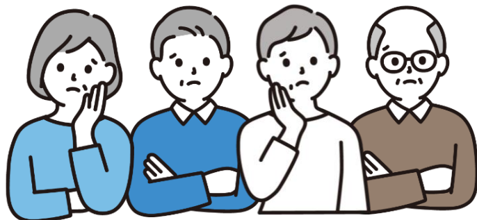
SNS型投資・ロマンス詐欺 被害者の年齢別割合