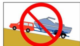
斜路等に放置禁止、白線内に駐車

★港湾法（第37条の3）の規定により陸域水域ともにボート等の放置は禁止です。強制撤去の対象となります。