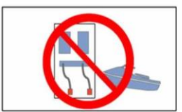
斜路内等での給油禁止