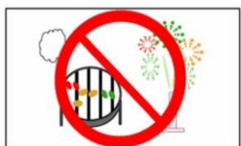
花火、バーベキュー等禁止