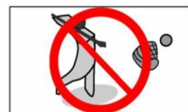
ゴルフ、キャッチボール等球技禁止