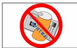
ゴミの散乱、ポイ捨て禁止