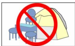
テント、イス等は禁止