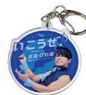
▲ノベルティ(イメージ)

先着で、滋賀県観光キャンペーン「いこうぜ♪滋賀・びわ湖」のアンバサダーである西川貴教氏を起用したロゴマークの亚克力キーホルダーを配布します。(無くなり次第終了)