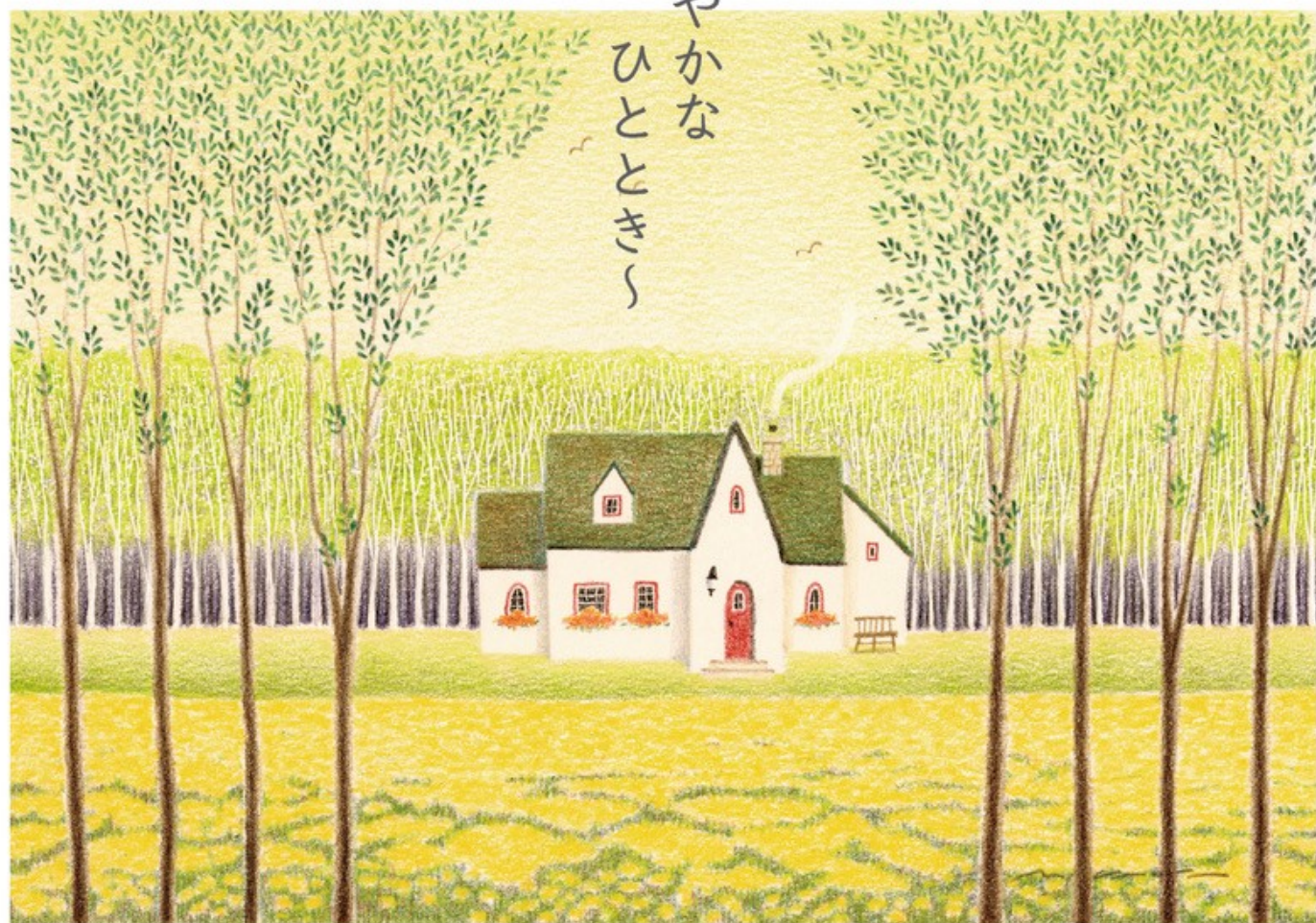
林の向こうに ©渡辺美香子