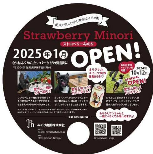
作成したうちわ型 PR チラシ

当課では、今後も栽培や観光農園運営へのサポートを通して、6次産業化による経営発展と地域の活性化に向けて支援していきます。