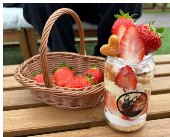
収穫したイチゴで体験できる スイーツづくり