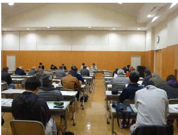
草津あおばな館の研修風景

当課は今後も「きらみずき」の安定した栽培が行われ、生産者と消費者のどちらからも選ばれる品種となるよう関係機関と連携して支援をしていきます。