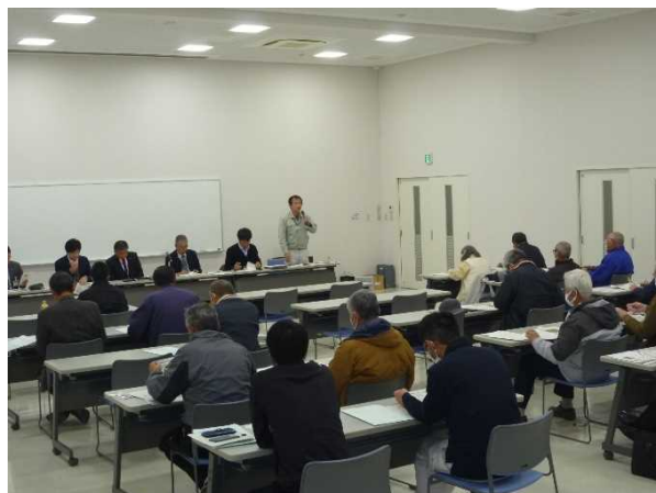
JAレーク滋賀中主営農経済センターの研修風景