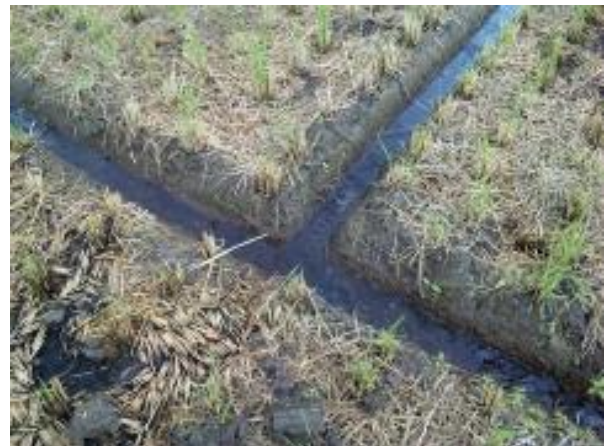
つなぎ目はしっかりつなぐ！

播種前には、排水溝をしっかりと点検し、排水溝が崩れている場合は溝さらえを行い、ほ場に水が滞水しないよう排水口までしっかりとつなげましょう。