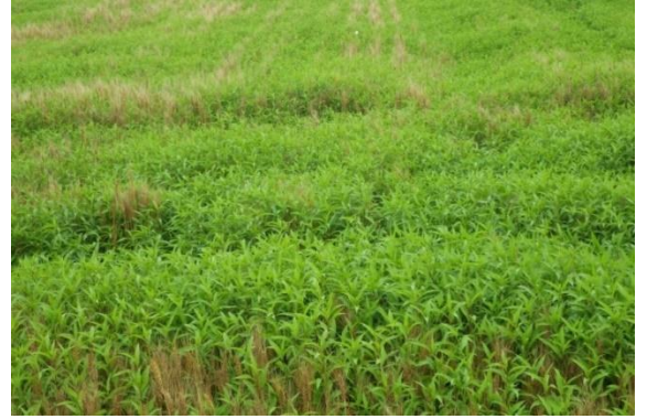
ハルタデが繁茂したほ場