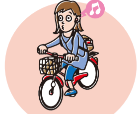
イヤホン等を使用し、音楽を聴きながら運転