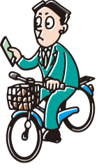
スマホを操作しながら運転