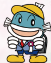
滋賀県イメージキャラクター キャッピー