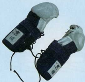
剣道用の籠手