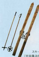
スキー板とストック