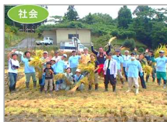
農村地域での多様な主体との連携推進