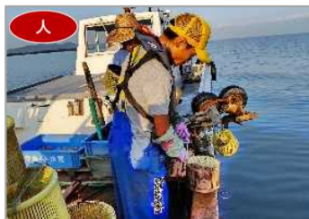
新規漁業者の確保に向けた取組