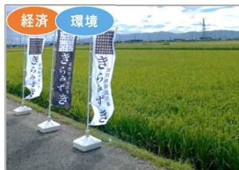
水稻新品種「きらみずき」の開発・普及