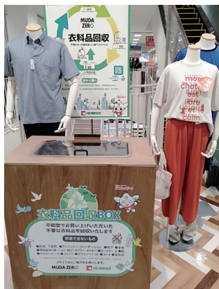
衣料品回収ボックス