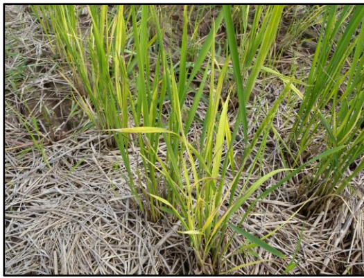
写真1 イネ縞葉枯病が発病した刈り株再生芽