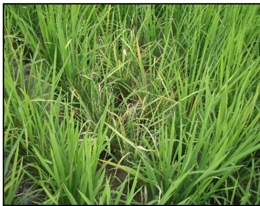
写真2 立毛中のイネ縞葉枯病の発病株 (左) 分けつ期の病徴