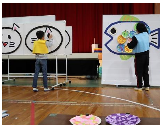
小学部 学習発表会

教育目標に基づいて、“力いっぱい生きる子ども”の育成を目指し、小学部・中学部・高等部の12年間を見通した系統的な教育課程づくり、安心・安全な学校づくりを進めています。また、保護者・関係機関・地域社会との密接な連携を図り、個別の教育支援計画・個別の指導計画を作成し、日々の学習を進めています。