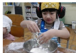
授業の様子 (小学部・遊びの指導)