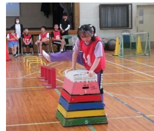
授業の様子 (高等部・体育祭の練習)

本校のセンター的機能としては、地域支援コーディネーターを中心に校区内の保育園、幼稚園、認定こども園、小学校、中学校、高等学校を対象に巡回教育相談を実施しています。また、就学・入学相談、障害や発達についての相談等をおこなっています。その他、地域の保育士や教員を対象とした研修会も開催しています。