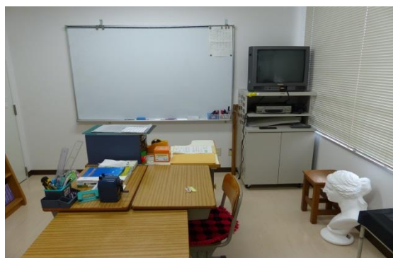
あすなろ学級教室内

教科担任制で、水口中学校の教師が時間割に合わせて授業を行っています。病気やけがの治療に専念しながら生徒たちは意欲的に教室に通ってきています。