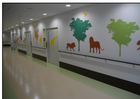
甲賀病院内小児科

城下町として栄えた水口町は、甲賀市の文化や産業の中心地であり、水口小学校は、明治7年開校の伝統を誇る小学校です。わかば学級は滋賀県内でもいち早く昭和52年に病気療養児のために甲賀病院内に設置された学級です。入院中も、こどもたちが教育を通して自ら輝いて生き生きと成長してほしいと願って学級は運営されています。