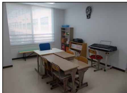
わかば学級教室内

甲賀病院に入院し、治療・療養しながら教育が受けられる学級です。別表のような日課で、入院児の該当学年にできるだけ沿ったカリキュラムで実施し、あわせて療養生活に必要なことを学ぶための自立活動の時間を設けています。日課もカリキュラムも個々の実態に応じた個別指導をしています。病院や病棟行事、本校や前籍校(入院する前に通っていた学校)の行事や、地域の行事などに、できるかぎり参加しています。