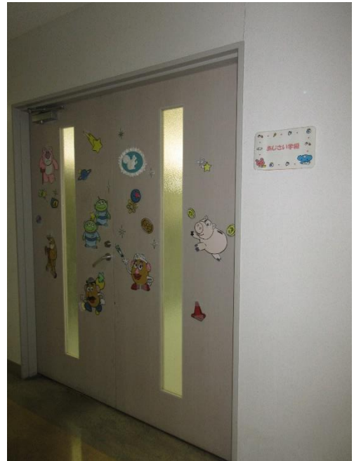
あじさい学級 入口