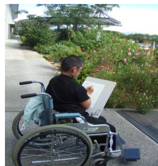
(病院内のスケッチ画作成)