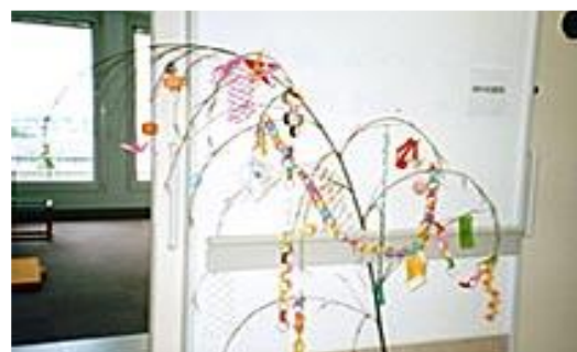
児童や病院職員らでつくった七夕飾り