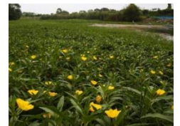
オオバナミスキンバイの繁茂状況