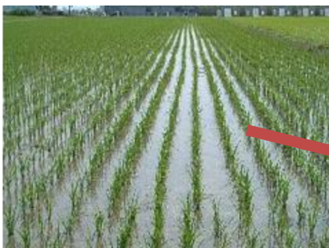
中干し開始時期の株張りの目安