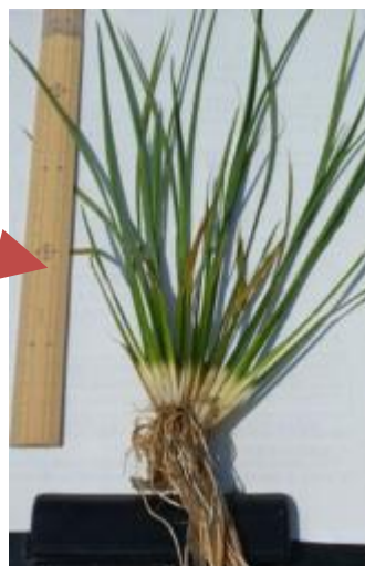
←中干し開始時の コシヒカリ茎数 15本