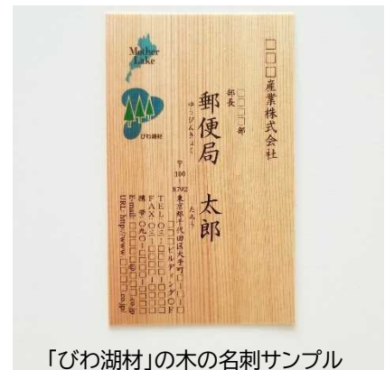
「びわ湖材」の木の名刺サンプル

地域の森林資源の有効活用により、滋賀県の森林の保全や、SDGs、マザーレイクゴールズ(MLGs)への貢献にもつながります。