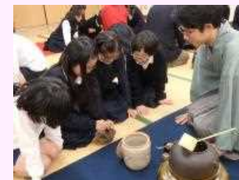
ちゃ たいけん ようす お茶をたてる体験の様子