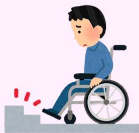
だんさ とお 段差で通れないときに、スロープを付ける