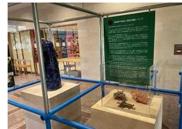
しがけんりつびじゅつかん ようす 滋賀県立美術館の様子

※5 ばりあふりーろうどくげき バリアフリー朗読劇とは、 げき はじ まえ 劇が始まる前に、 てんじ ばんふれっと 点字のパンフレットを配り、 くば 劇の間は、 げき あいだ スクリーンに すくりーん セリフ せりふ をうつすなど、 しょうがい ひと ひと たの 障害のある人もない人も くふう ろうどくげき 楽しめるように くふう 工夫した ろうどくげき 朗読劇のこと。