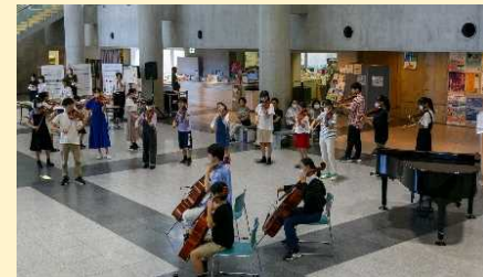
しがけんげいじゅつぶんかさいおーびにんくいべんと ようす 滋賀県芸術文化祭オープニングイベントの様子