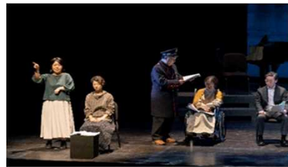
ばりあふりーろうどくげき ようす バリアフリー朗読劇の様子