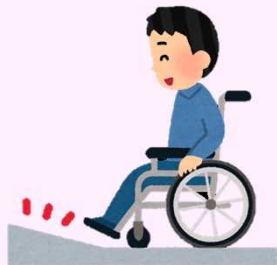
するーぷ つ スロープを付ける