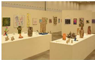
とあーとてん ようす ぴかつtoアート展の様子