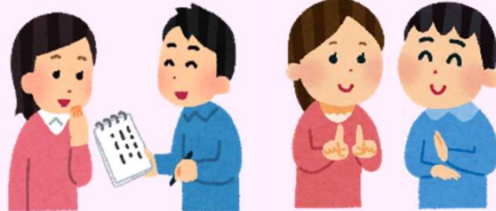
ちょうかく しょうがい ひと しゅわ ひつだん たいおう 聴覚に 障害のある人に、手話や筆談で対応する