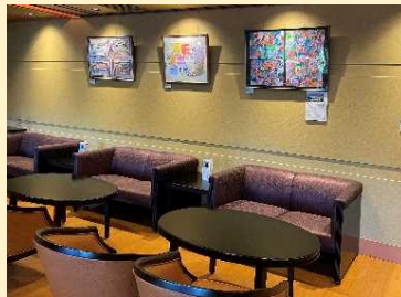
ほてる りよかん しょうがい ひと さくひん てんじ ようす ホテルや旅館などで、障害のある人の作品が展示されている様子