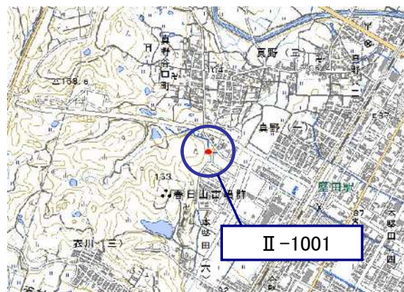
土砂災害警戒区域・土砂災害特別警戒区域 位置図