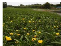
オオハナミスキンバイの繁茂状況