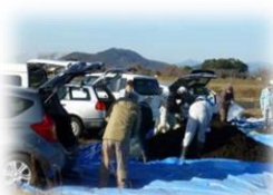
たい肥の無料配布