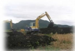
有効利用(たい肥化)