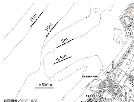
図1 松原漁場の水深別定線（破線）

セタシジミの産卵前の肥満度は近年大きく変動しており、北湖一円の漁場で値に差はあるものの、その増減傾向はほぼ一致している。全湖的な現象と考えられるこの変動をより詳細にとらえるため、2010年度以降、主要漁場の一つで水深の幅が広い松原漁場において肥満度のモニタリング調査を実施している。