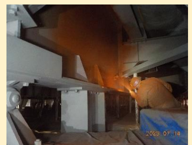
【中はこうなっています!】