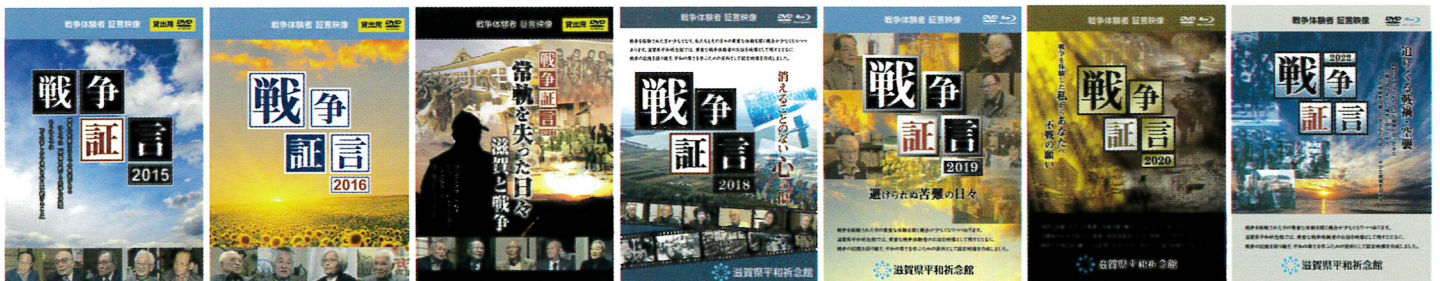
【戦争証言2015】 【戦争証言2016】 【戦争証言2017】 【戦争証言2018】 【戦争証言2019】 【戦争証言2020】 【戦争証言2022】