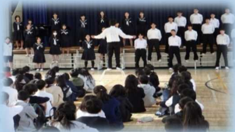
学級の仲間と創り上げた歌声を小学生に披露

欠席の背景をしっかりと掴まないと「登校を促す指導が本人を苦しめる」 「いじめ、虐待、精神疾患など待っていてはいけない」ケースもある！