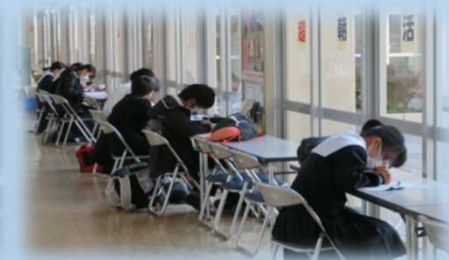
職員室前廊下で自ら学習する「超朝活」の取組

近年、いじめ、暴力行為、不登校等の生徒指導上の課題は深刻化し、いじめ防止対策推進法等の生徒指導に関する法律が施行されるなど、生徒指導を巡る状況は大きく変化しています。これらの状況を踏まえ、令和4年12月には生徒指導提要も改訂され、新たな視点での対応が求められています。特に不登校児童生徒は全国的にも増加し、背景も多様化しており、個々に応じた的確な支援を進めることが大変難しい状況です。しかし、この状況でも誰一人取り残さず支援をするためには、教育機会確保法の基本理念等の更なる理解と、できる限り不登校を生み出さないように積極的な生徒指導を進めることが大事です。その上で、休み始めのアセスメントに基づく対応を進め、それでも欠席が長期に続く場合は特別な支援と関係機関連携を進める必要があります。