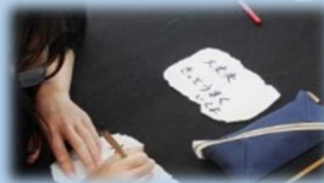
やる気、元気になれる言葉の作品をつくる授業